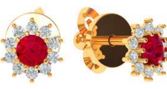
СП-541 (2.5 гр) Ф3-2 шт Ф 1.25-20 шт