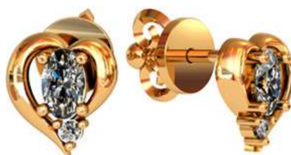
СП-475 (2.22 гр) Ов-5x3-2 шт Ф1.5-2 шт