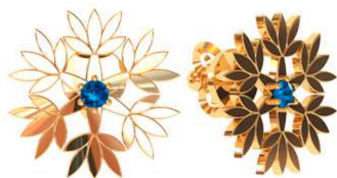
СП-543 (2.4 гр) Ф1.75-2 шт