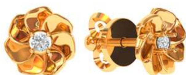
СП-533 (2.1 гр) Ф2-2 шт