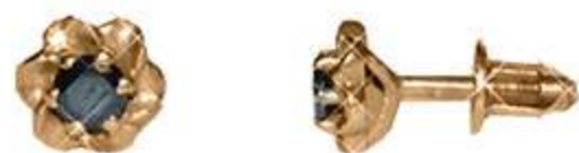
СП-555 (1.4 гр) Ф3.5-2 шт