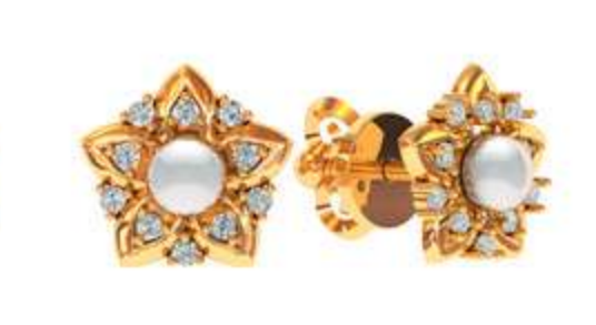
СП-542 (1.9 гр) Ж-3-2 шт Ф1.0-20 шт