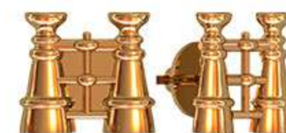
СП-993 (1.4 гр)