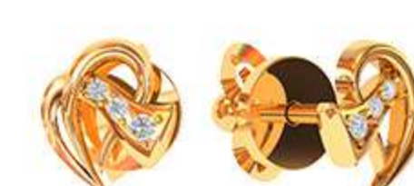
СП-526 (1.7 гр) Ф7.25-2 шт Ф7.0-4 шт