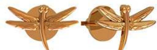
СП-985 (1.1 гр)