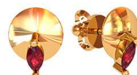
СП-491 (2.5 гр) Мз-5x2.5-2 шт