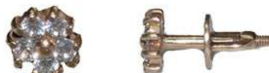
СП-551 (1.1 гр) Ф1.75-10 шт