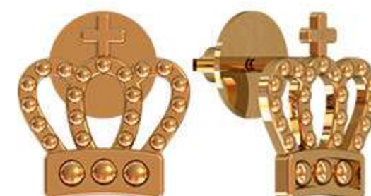
СП-988 (1.2 гр)