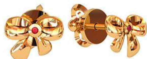
СП-485 (1.3 гр) Ф1.0-2 шт