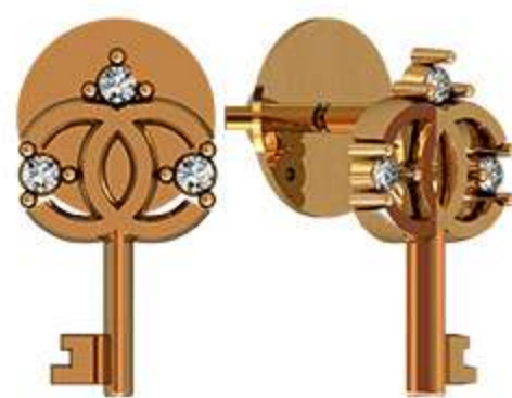
СП-991 (1.0 гр) Ф1.25-6шт