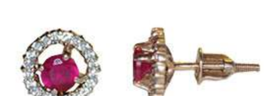
СП-547 (2.7 гр) Ф4.5-2 шт Ф1.0-40 шт