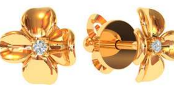
СП-539 (1.9 гр) Ф1.5-2 шт