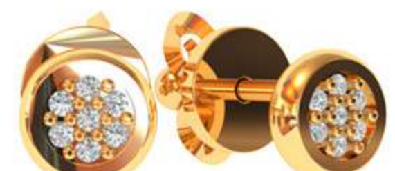
СП-545 (1.9 гр) Ф7.0-74 шт