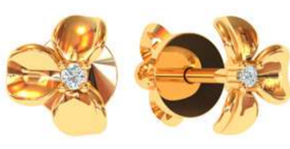
СП-540 (1.7 гр) Ф1.5-2 шт