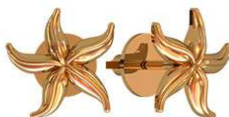
СП-986 (1.3 гр)