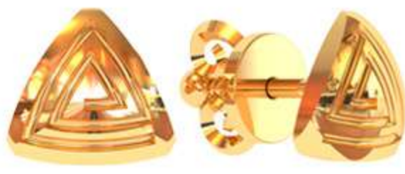
СП-535 (1.9 гр)