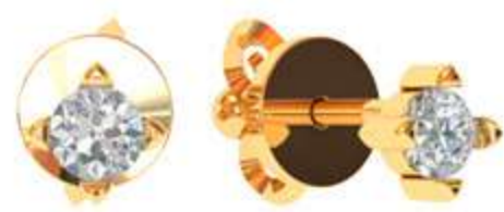
СП-544 (1.4 гр) Ф2.5-2 шт