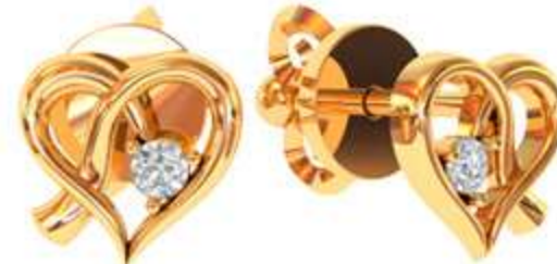
СП-531 (1.8 гр) Ф2-2 шт