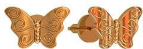
СП-984 (1.4 гр)