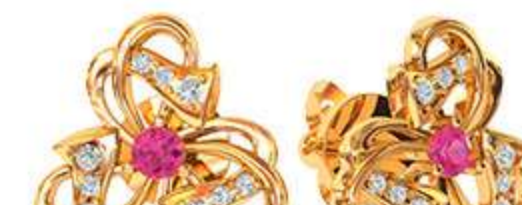
СП-527 (2.8 гр) Ф2.5-2 шт Ф1.25-6 шт Ф1.0-12 шт