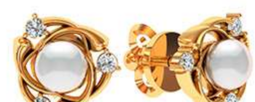
СП-525 (2.3 гр) Ж-5-2 шт Ф7.75-6 шт