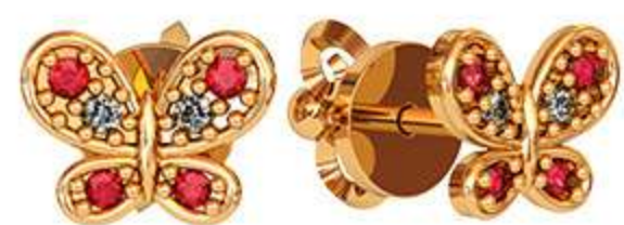
СП-483 (1.56 гр) Ф1.5-В шт Ф 1.25-4 шт