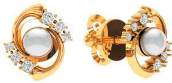
СП-538 (2.1 гр) Ж-4-2 шт Ф 1.5-4 шт Ф 1.25-4 шт Ф1.0-4 шт