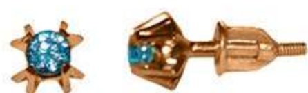
СП-558 (1.3 гр) Ф3.5-2 шт