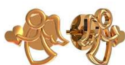
СП-995 (1.3 гр)