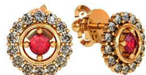
СП-490 (2.8 гр) Ф3-2 шт Ф7.75-28 шт