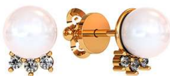
СП-488 (2.56 гр) Ж7-2 шт Ф1.75-6 шт