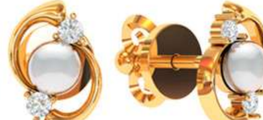
СП-537 (2.0 гр) Ж-4-2 шт Ф1.75-4 шт