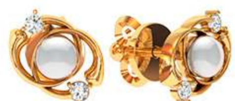
СП-524 (2.0 гр) Ж-4-2 шт Ф7.75-4 шт