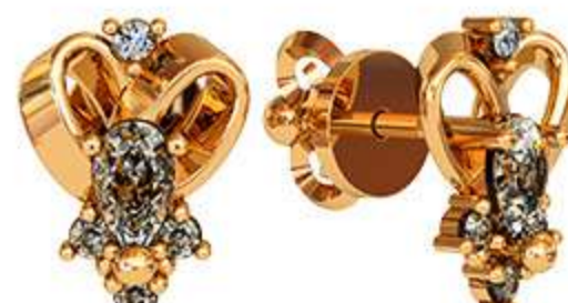
СП-480 (1.99 гр) Гр-5x3-2 шт Ф1.5-В шт