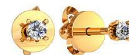
СП-482 (1.04 гр) Ф2.5-2 шт