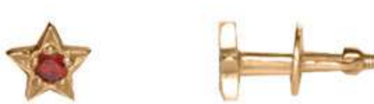
СП-552 (1.1 гр) Ф2.0-2 шт