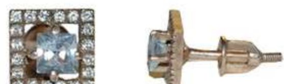
СП-549 (2.1 гр) Кв-3.5-2 шт Ф 1.0-40 шт