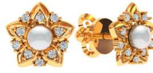
СП-532 (2.3 гр) Ж-4-2 шт Ф 1.25-20 шт