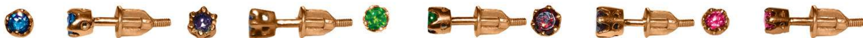
СП-583 (1.1 гр) Ф2.75-2 шт