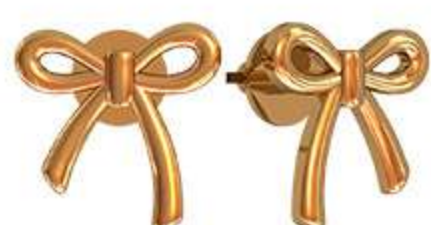
СП-994 (1.4 гр)