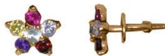
СП-556 (1.3 гр) Ф2.5-12 шт