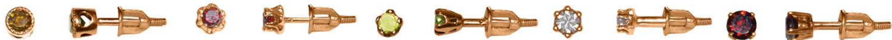
СП-578 (1.8 гр) Ф4.0-2 шт