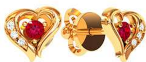
СП-523 (1.9 гр) Ф2.5-2 шт Ф7.0-6 шт