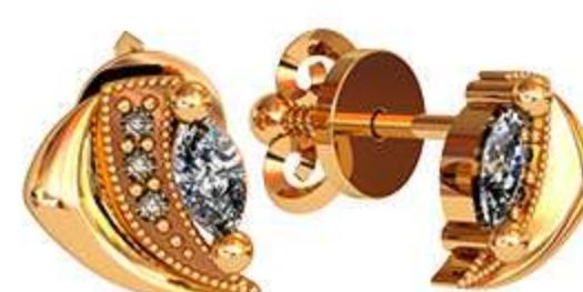
СП-481 (1.98 гр) Мз-5x2.5-2 шт Ф1.25-6 шт