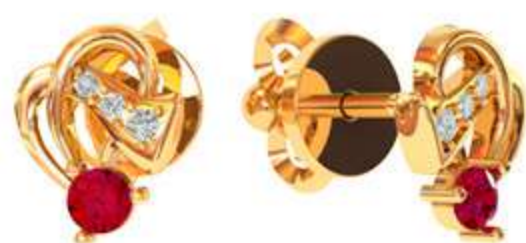
СП-528 (1.9 гр) Ф2.5-2 шт Ф 1.25-2 шт Ф1.0-4 шт