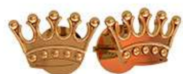
СП-990 (1.1 гр)