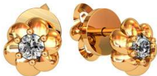
СП-474 (1.64 гр) Ф3-2 шт