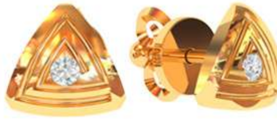
СП-536 (1.9 гр) Ф2-2 шт