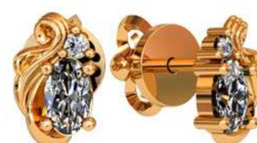
СП-477 (1.96 гр) Ов-5x3-2 шт Ф7.5-2 шт