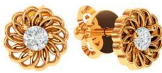
СП-529 (2.4 гр) Ф3-2 шт