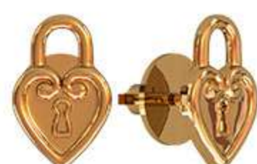
СП-999 (1.4 гр)