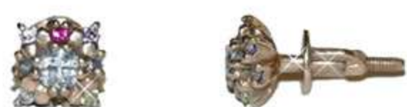
СП-550 (1.7 гр) Ф2.75-2 шт Ф1.25-16 шт