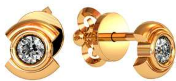
СП-473 (1.9 гр) Ф3-2 шт