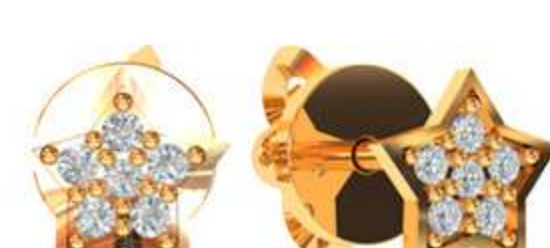
СП-546 (1.7 гр) Ф1.25-12 шт