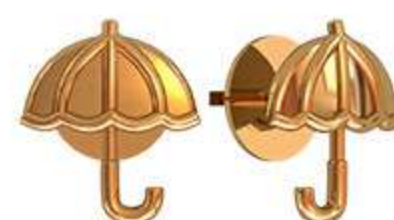
СП-992 (1.1 гр)