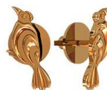
СП-997 (1.1 гр)