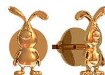
СП-998 (1.0 гр)