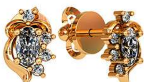
СП-478 (1.99 гр) Ов-5x3-2 шт Ф1.5-В шт