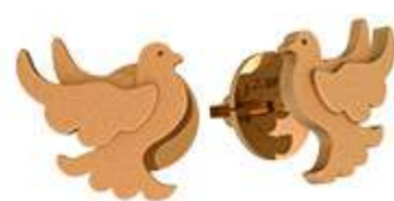
СП-996 (1.3 гр)