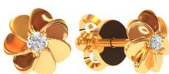
СП-534 (2.1 гр) Ф2-2 шт