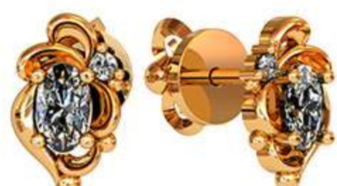
СП-479 (1.96 гр) Ов-5x3-2 шт Ф1.5-2 шт