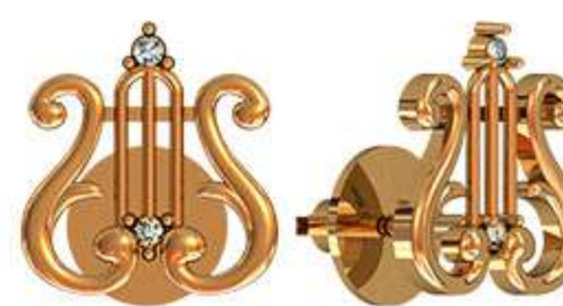
СП-987 (1.2 гр) Ф1.0-2 шт Ф1.25-2 шт