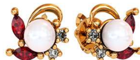
СП-487 (2.98 гр) Ж5-2 шт Мз-4x2-4 шт Ф2-4 шт