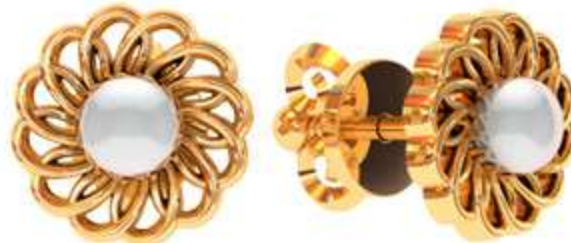
СП-530 (2.9 гр) Ж-4-2 шт