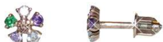
СП-548 (1.2 гр) Ф2.5-2 шт Ф2.0-10 шт